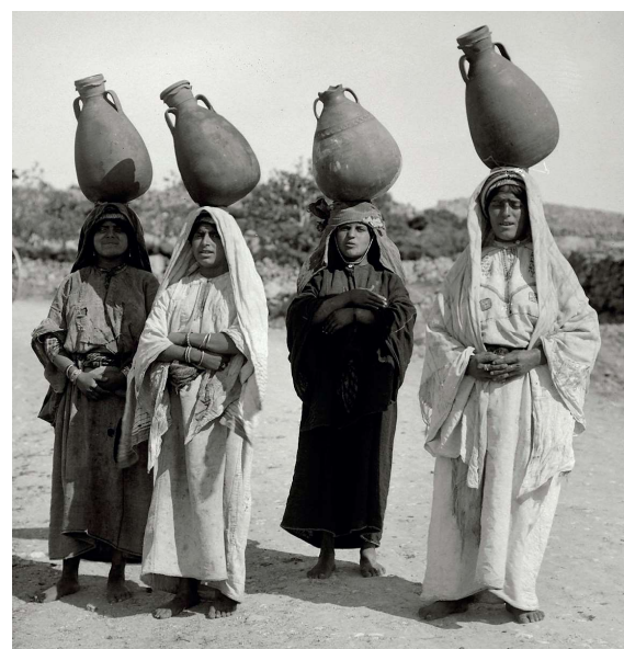
En gruppe kvinder henter vand ved brønden.