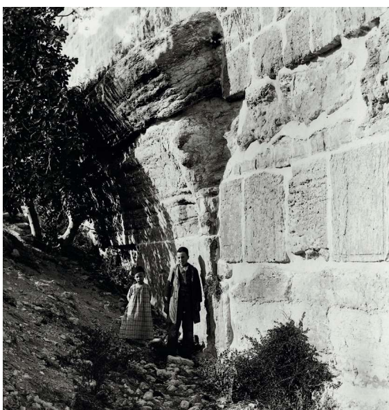
Dette gamle foto af Robinsons bue på Vestmuren til Tempelpladsen viser, hvordan jorden engang nåede helt op til buen. Efter udgravningerne i 1969-76 er hele muren nedenunder frilagt.