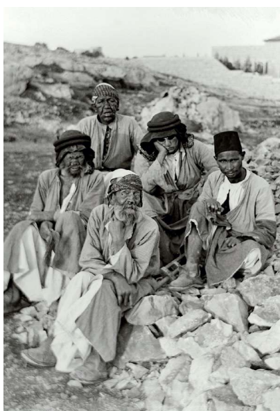
En gruppe af spedalske tigger om almisser.